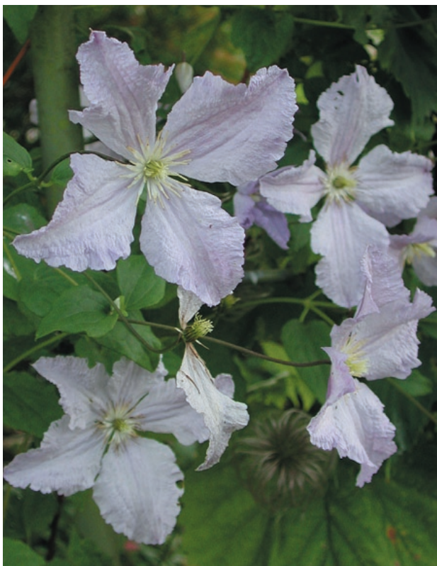
Klematis 'Blue Angel'